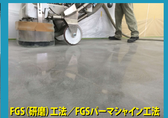
FGS(研磨)工法/FGSパーマシャイン工法

仕上方法により費用や仕上がり感(光沢・平滑性など)が異なります。詳しくはぐっどふるあ施工店までお問い合わせください。