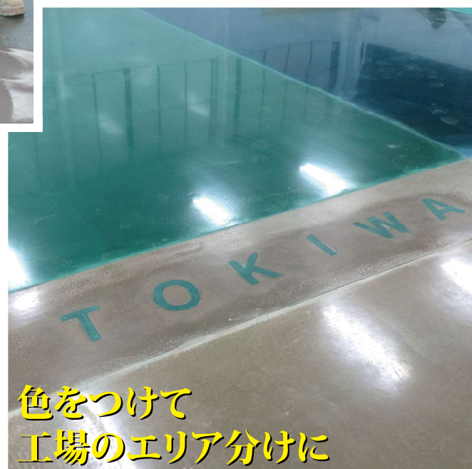
色をつけて 工場エリア分けに

製品名 NXT LEVEL DL (NXTレベルDL) ※旧製品名 DRYTEK LEVELEX DL メーカー名 LATICRETE International, Inc. ラテイクリート・インターナショナル社(米国コネチカット州) 荷姿 55ポンド(25kg)袋入り 用途 床仕上層及び床下地用セルフレベリングモルタル 研磨(#400~#1500)により光沢のある仕上がが可能です。 粒子が細かく、かつ付着性が高いため、クラック補修やピンホール補修などに使うこともできます。 使用方法 NXT LEVEL DL 1袋につき水4.3~5.2ℓ(下地用として使用する場合は5.3~5.7ℓ)を投入し、攪拌ドリルを使用して2~3分ミキシングの後、施工箇所に注いでください。 詳しくは製品データシート(DS-87.5)を参照ください。 提供方法 認定施工店による責任施工を推奨