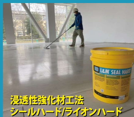
浸透性強化材工法 シールハード/ライオンハード