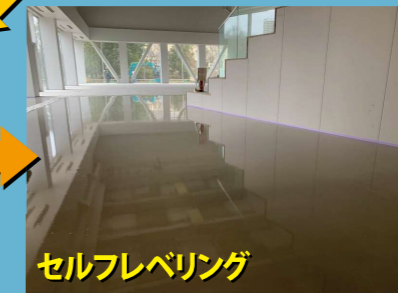
セルフレベリング